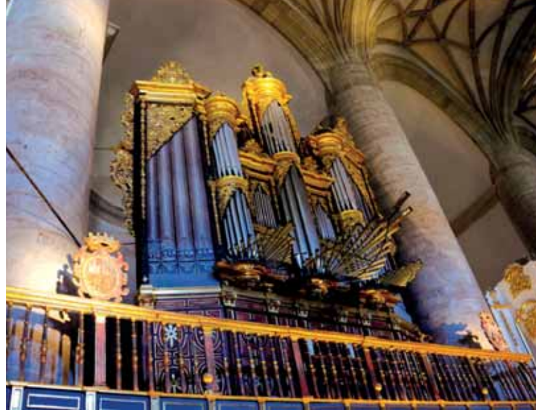
Órgano de la iglesia del monasterio en restauración