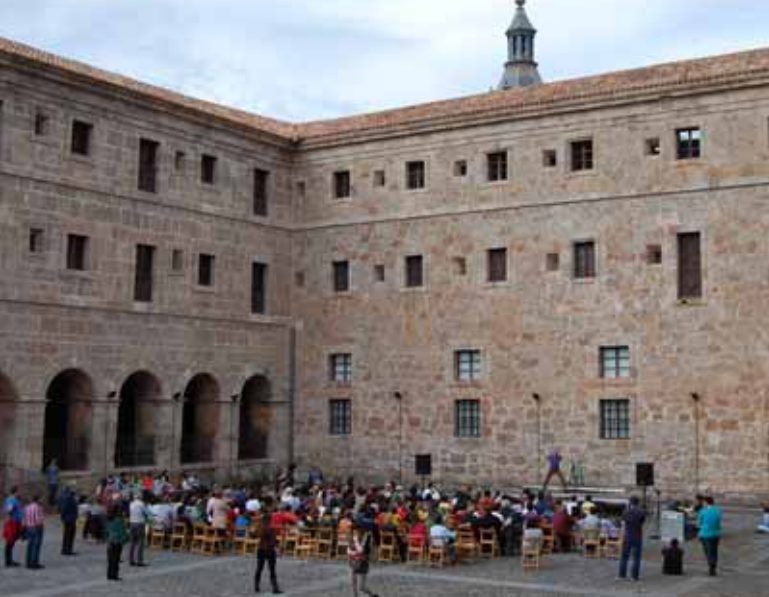
Representación de la pieza musical "Pedro y el lobo" en el patio del monasterio