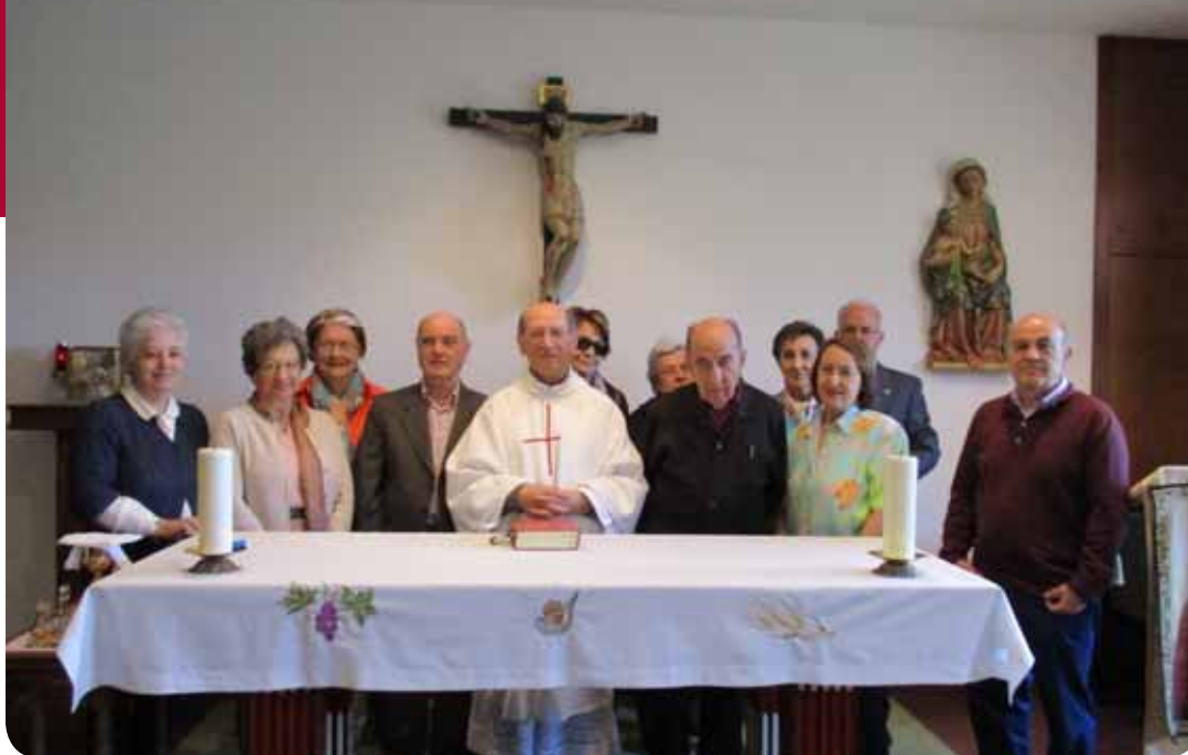
Eucaristía en el Centro de Espiritualidad del monasterio.

La mayor es hija del “engaño”; yo joven inexperta, fui engañada. El segundo es hijo del “fracaso”; pues con la experiencia anterior confié en un hombre y me fracasó. Y preguntada por los otros dos, respondió: El tercero es por la “soledad”, usted comprenderá padrecito, y la cuarta es por la “necesidad”.