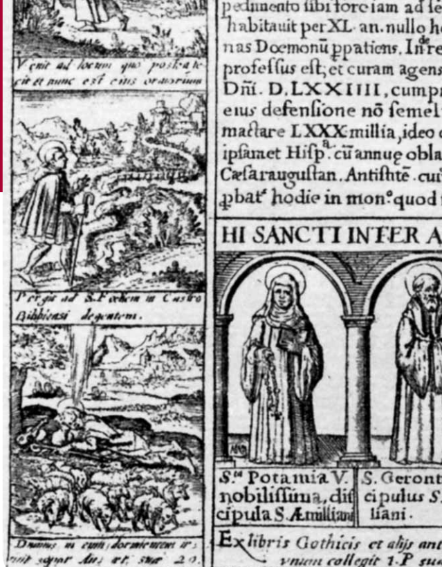
Santa Potamia en el grabado de Matthaus Greuter de 1608

Su cuerpo fue sepultado en dicha ermita. El abad fray Pedro de Medina, en vista del culto y milagros de santa