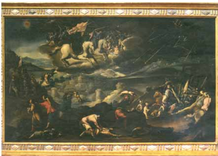
“San Millán y Santiago en la batalla de Simancas”. Óleo cedido a la exposición “Camino de Santiago”