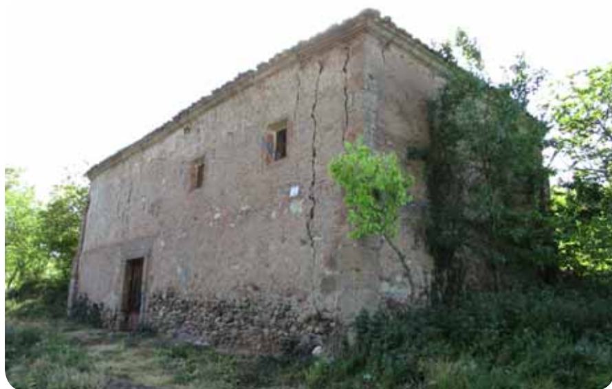
Ermita de Santa Potamia en su estado actual