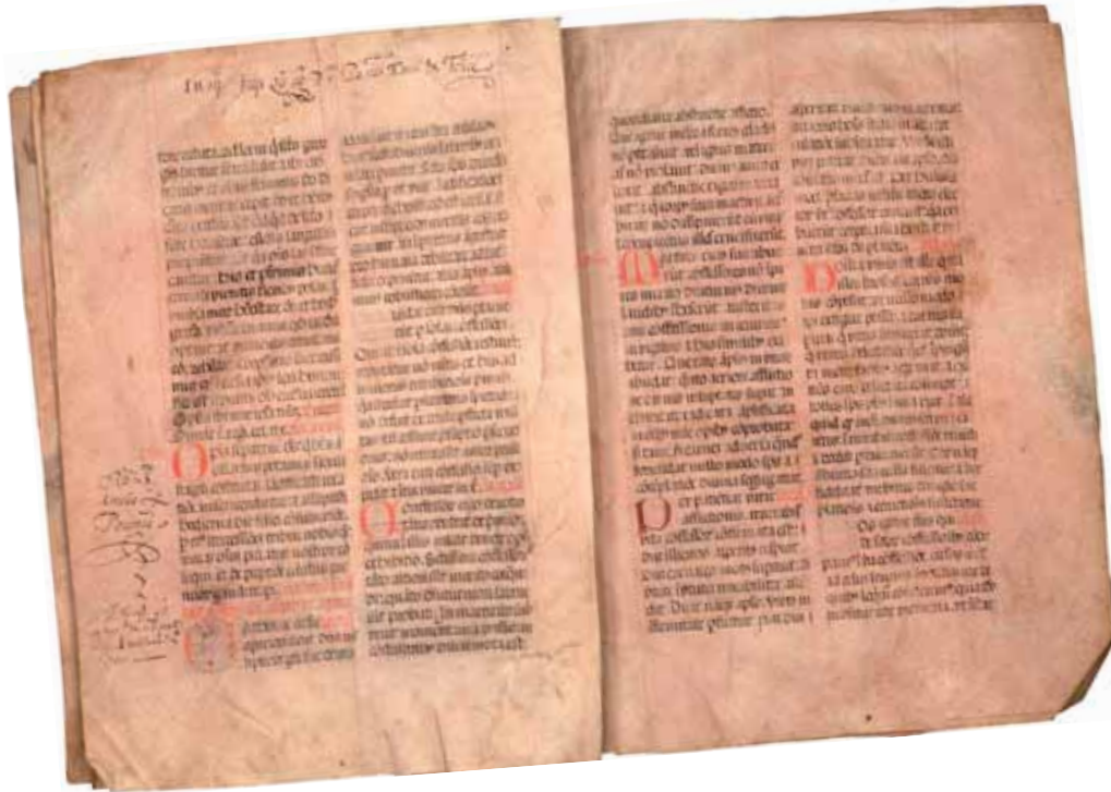
“Rezo de Santa Potamia” del manuscrito del s.XIII de la biblioteca del monasterio de Yuso

Los santos de la Iglesia no suelen ir en solitario, sino en racimo. Así, por ejemplo, san Benito fue fundador, maestro y guía de otros muchos santos llamados de la orden o de la familia benedictina. Lo mismo se diga de san Agustín, san Francisco de Asís, santa Teresa de Jesús, san Juan de Ávila, santo Domingo de Guzmán, san Ignacio de Loyola, san José María Escrivá y tantos otros.