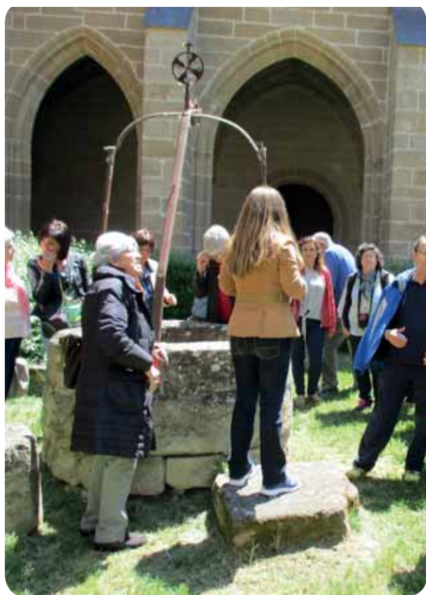
Visita al monasterio de Ntra. Sra. de la Piedad de Casalarreina

En visita pastoral en la parroquia de Huambos se topó con una casita en la que correteaban cuatro niños entre ocho y dos años. Preguntó por el padre de los niños y una señora joven, le dijo: Ay, taitito, si le dijese a usted. La animó para seguir y le dijo: