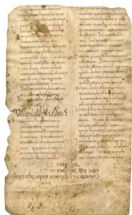
Fragmento 2 de Nájera

otros documentos, apareciendo anotaciones superpuestas en letra gótica caligráfica y humanística cursiva, de los siglos XV y XVII con los topónimos de Villarrica y San Asensio , localidades que pertenecían al cenobio najerense. Llegaron a Silos junto con el fragmento de Cirueña.