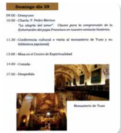
Parte del díptico del programa de la X Convivencia