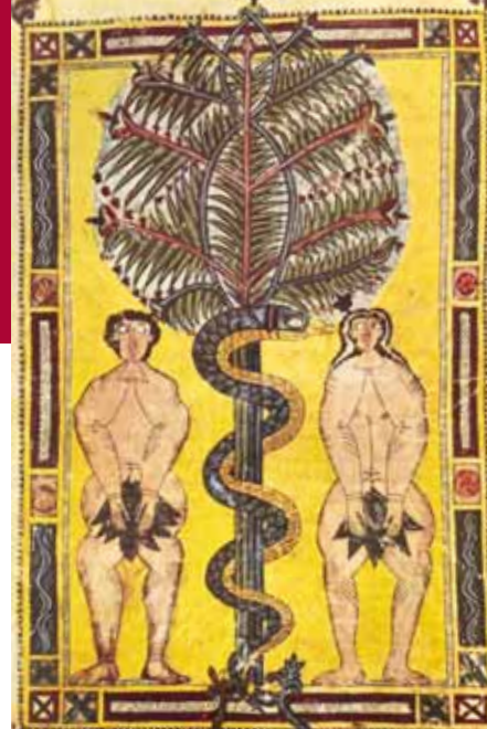
Beato de El Escorial. Folio 18r