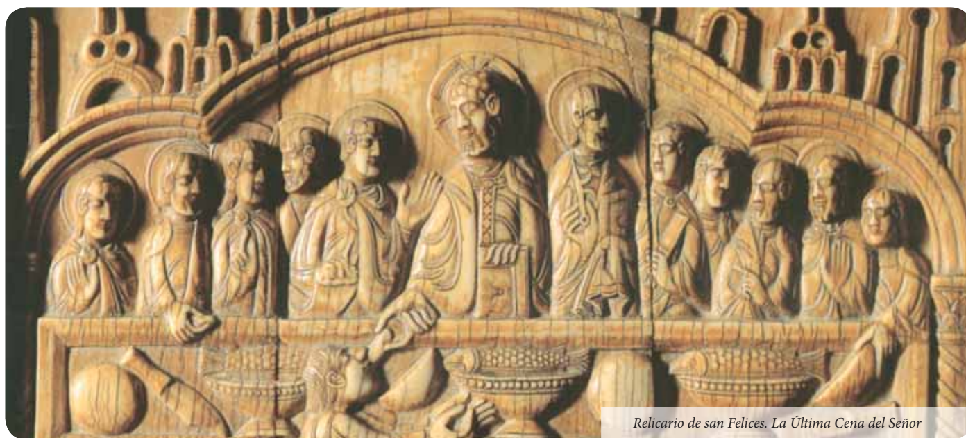
Relicario de san Felices. La Última Cena del Señor

No puedo terminar sin agradecer al padre prior del monasterio la gran ayuda que nos presta. Y a todos vosotros, queridos amigos, os deseo unas felices vacaciones, a la vez que pido a nuestro patrón san Millán que nos siga asistiendo en el camino de nuestras vidas.