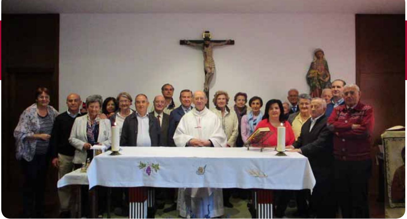
Asistentes a la X Convivencia al finalizar la eucaristía del domingo.