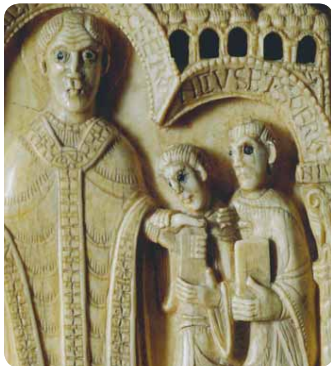
San Gerontio y san Sofronio presentan el códice y el manípulo a san Millán

Pienso que también pudo estar en la ermita de las Tres Celdas para interrogar a Citonato y Gerontio, los últimos y venerables supervivientes y garantes de la vida y milagros de san Millán.