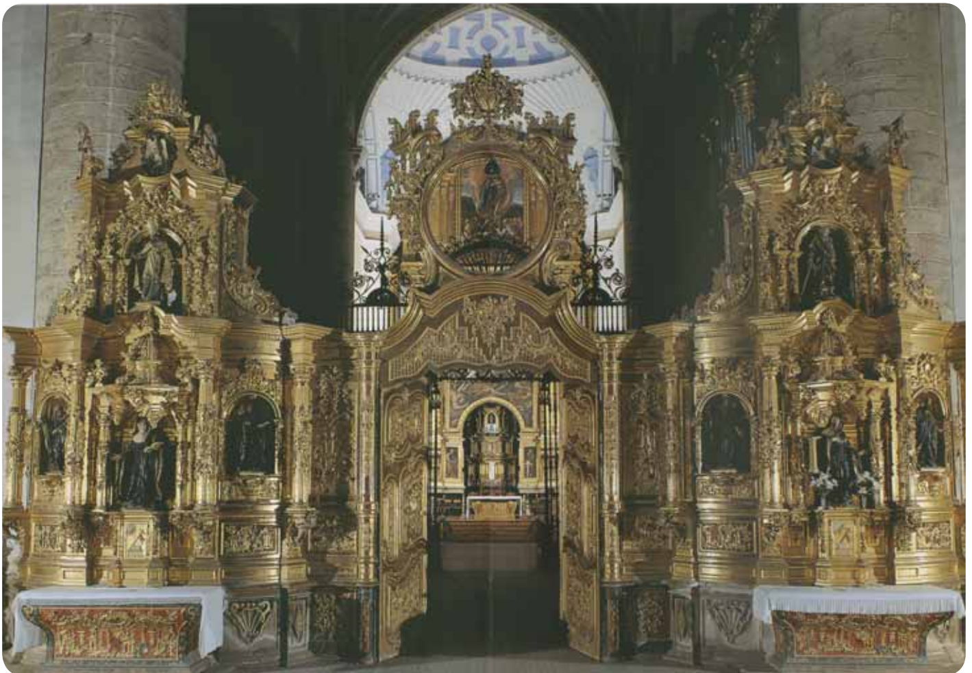
Trascoro de la iglesia de Yuso que contiene la iconografía de los santos emilianenses.