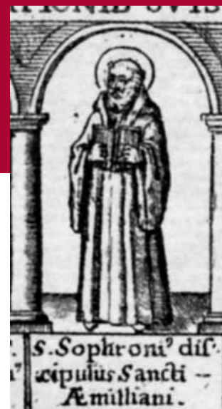
San Citonato, san Gerontio y san Sofronio en el grabado de Matthäus Greuter de 1608

Su mandato parece que se inicia a la muerte de san Millán, año 574. Y termina el año 591, cuando Citonato renuncia a su cargo en Suso para trasladarse con dos compañeros, Gerontio y Sofronio, al valle próximo de Tobía y Matute.