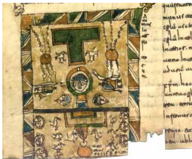
La miniatura del fragmento de Cirueña

Hasta el siglo XIX permaneció en el monasterio de Yuso y a raíz de la Desarmortización de Mendizábal fue trasladado a la Biblioteca Nacional de Madrid donde se conserva.