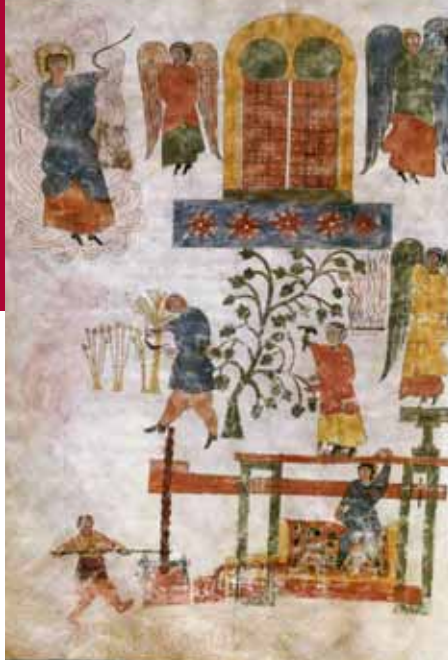
Beato emilianense. Folio 98v

Sirvieron en su día de guarda o carpeta de archivo de