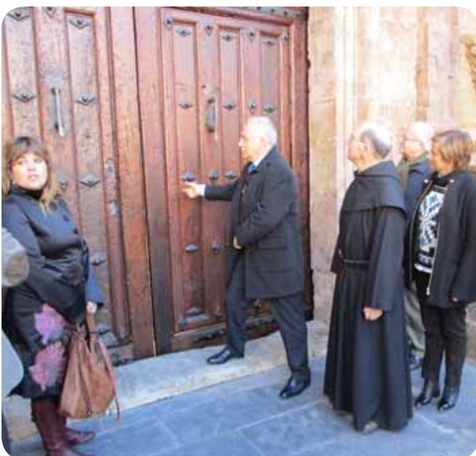
Inauguración de la restauración del portón principal del monasterio