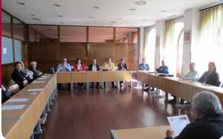
Desarrollo de una charla

lla, con la presidencia de honor del príncipe Felipe, sucediéndose visitas importantes, destacando la del presidente José M a Aznar con la celebración de un consejo de ministros.