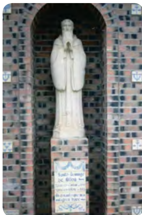
Escultura de santo Domingo en la plaza de Cañas

Reclamado por el abad y los monjes de San Millán, Domingo retorna a la casa madre,