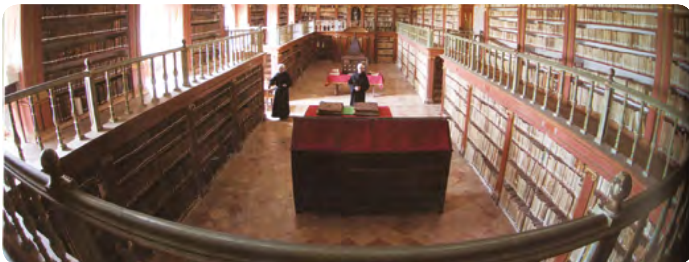
Vista panorámica de la biblioteca monástica de Yuso