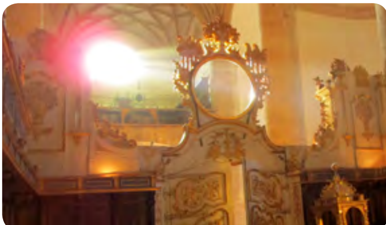
El rayo solar que cruza la ventana de la fachada occidental, en la tarde de los equinoccios se alinea con el gnomon que construyó Busou para filtrarlo durante la conjunción solar equinoccial

En el siglo XVIII este fenómeno solar debió ser bien conocido por los monjes del monasterio, en caso con-