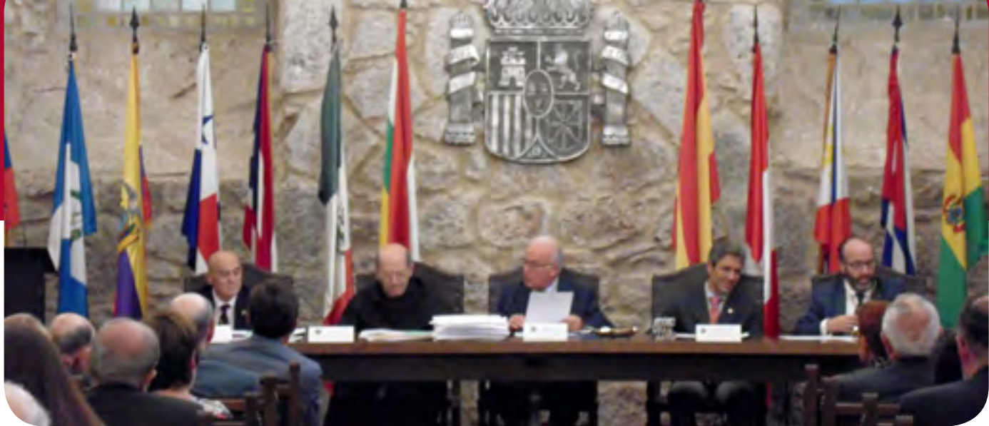
Celebración de la XLIV Asamblea general

Asunto nº 9. Por unanimidad se ratificó el acuerdo de la Junta directiva de aumentar en cinco euros la cuota anual de asociado, fijándola en cincuenta euros .