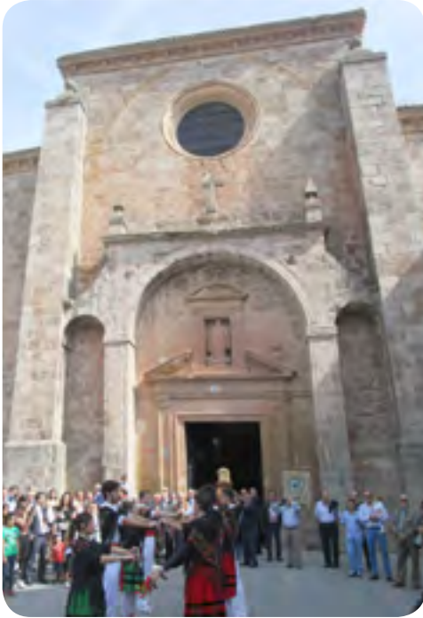
Fachada occidental. El rayo equinoccial cruza la ventana superior de la fachada