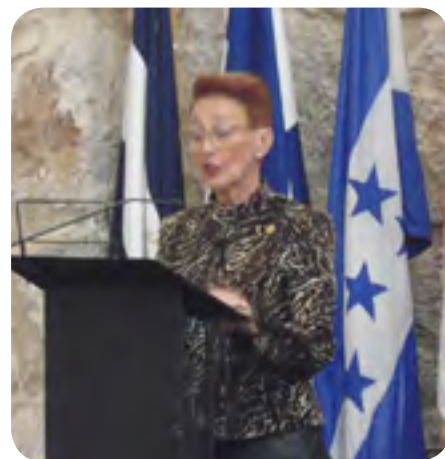
Conferenciantes en los actos de la Asamblea general