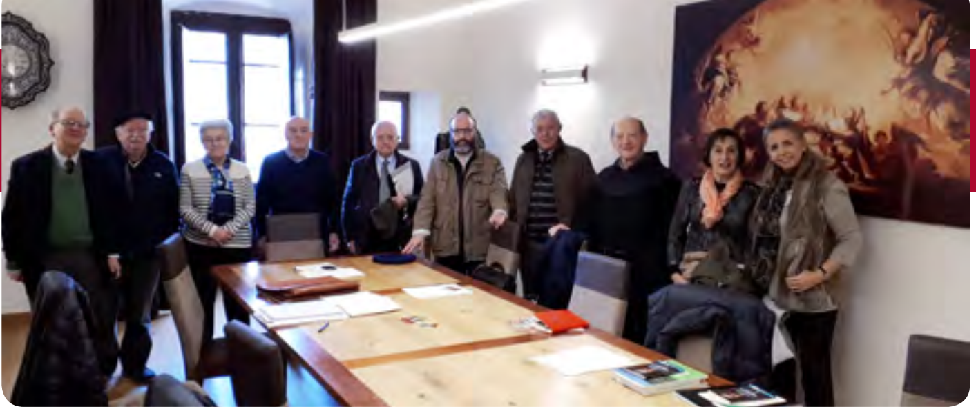
La junta directiva en la inauguración de la sala de los Amigos de san Millán

"Primatium" por la compañía de teatro "El mono habitado". Por la tarde en el claustro del monasterio un dúo cantó "Palabra de mujer", para terminar ya en la noche en el patio del monasterio con "Rojo", teatro gestual.