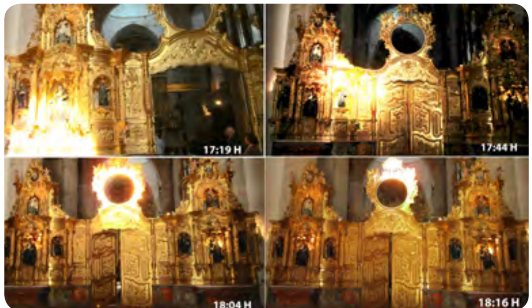
Trayectoria del Sol en la tarde del equinoccio de septiembre de 2017. Se especifica la hora civil en cada foto. El rayo solar recorre el trancoro, desde la base del altar de Santa Potamia hasta alinearse con el gnomon de Busou solamente durante los dos equinoccios anuales (21 de marzo y 21 de septiembre)

¿Para qué lo hicieron? Los efectos solares en equinoccios en monasterios e iglesias se hacían para ajustar el calendario solar con el calendario religioso y poder fijar las fiestas religiosas móviles cuando existía una discrepancia de hasta diez días entre el calendario juliano y el solar. Pero el trazado de la iglesia del monasterio se realizó durante los primeros años del siglo XVI, poco antes que el calendario gregoriano sustituyera al juliano, por lo que en principio, poseer un fenómeno de conjunción solar equinoccial para determinar exactamente el calendario litúrgico, puede tener sentido, como también lo hicieron algunos monasterios medievales. Pero cuando unos pocos años después se instauró el calendario gregoriano en España, parece que ya carecía de sentido disponer de un observatorio solar para ajustar el calendario litúrgico. ¿Por qué continuaron entonces con el proyecto del observatorio solar en el monasterio? Es una incógnita más del monasterio de San Millán, pero es un hecho que continuaron con su proyecto de conjunción solar equinoccial, dotando a su iglesia además, de una conexión cosmogónica uniendo el templo y el universo, o el mundo terrenal y celestial. ■