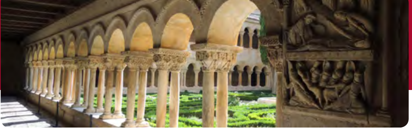
Claustro del ciprés de la abadía de Silos

lo que ocurre el año 1036. Durante su estadía en Cañas, García de Nájera sucede en el trono navarro (año 1035) a su padre, Sancho el Mayor. En fecha que no consta, pero que tuvo que ser después de 1036 y antes de 1041, el abad García, que después será obispo de Álava (1037-1056), otorga el priorato emilianense a Domingo: