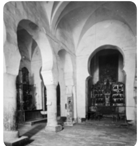
Fotografías de la exposición "San Millán de la Cogolla, otra mirada", datadas entre los años 1885 y 1920